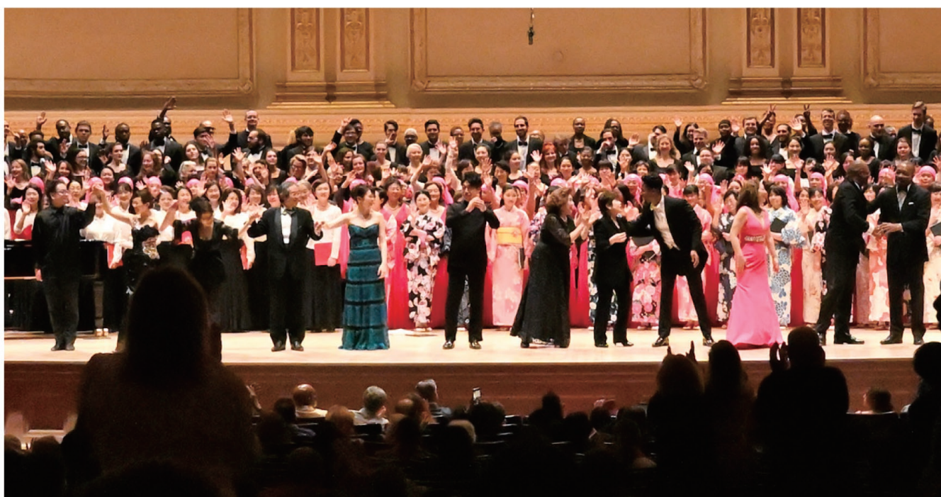
日米80人の青少年もステージに立った。手をふり名残りをおしんだ。