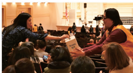
休憩時に募金が行われた