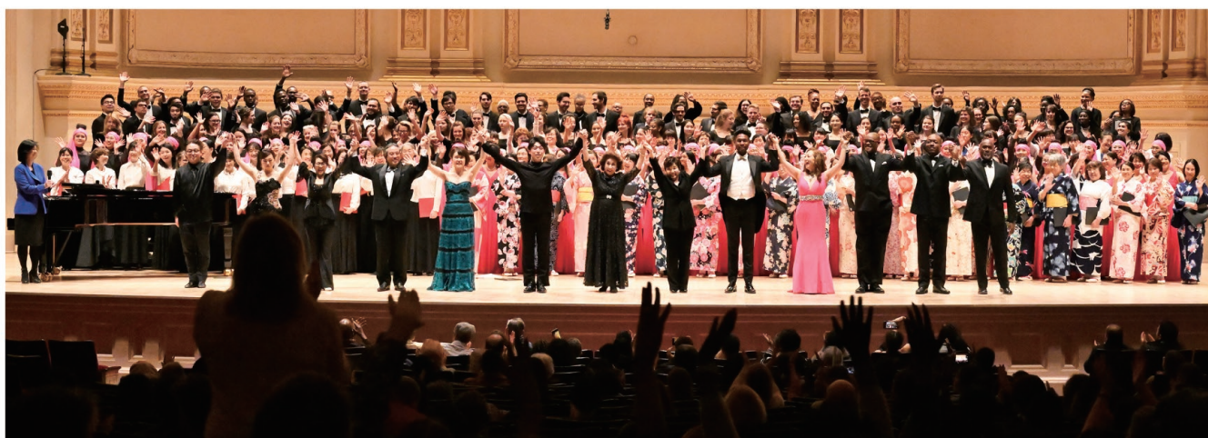
スタンディングオベーションに指揮者、合唱団全員が笑顔でこたえた。

日米親善と、東日本被災地・西日本豪雨被災地の復興支援をねらいとする「2019（第7回）ニューヨーク合唱フェスティバル」が2019年4月3日（水）、世界の音楽殿堂カーネギーホールで開かれた。日本から4つ、NYから4つ、ワシントンDCから1つ、合計9合唱団が集い合唱曲を熱唱した。日本情緒あふれる曲や米国のポピュラー曲などが次々に披露され、ホールは惜しめない拍手でつつまれた。「花は咲く」「さくら」「イマジン」「翼をください」はホールの聴衆も加わり大合唱になった。フィナーレにはステージが、客席が笑顔でつつまれた。歌声と拍手がひとつになり東日本被災地・西日本豪雨被災地へエールがおくられた。